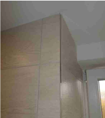
KERAM.OBKLAD S UKONČUJÍCÍ LIŠTOU